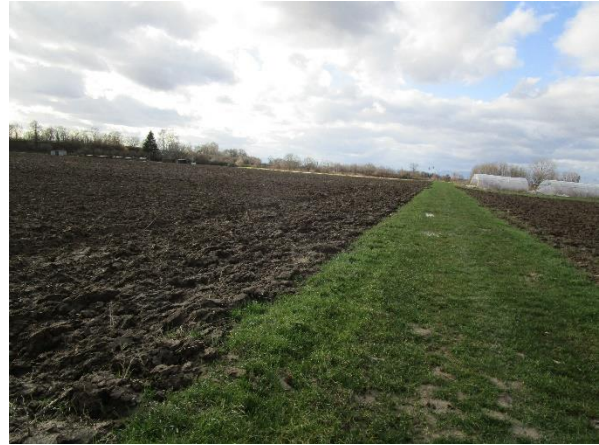
Nördliche Grenze des Plangebiets mit Grasweg.