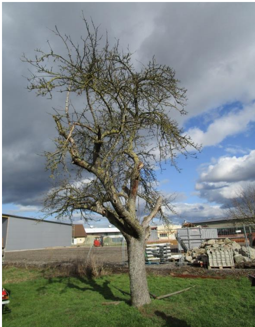
Walnussbaum mit Starenbruthöhle nordöstlich außerhalb des Plangebiets am Kreuzweg.