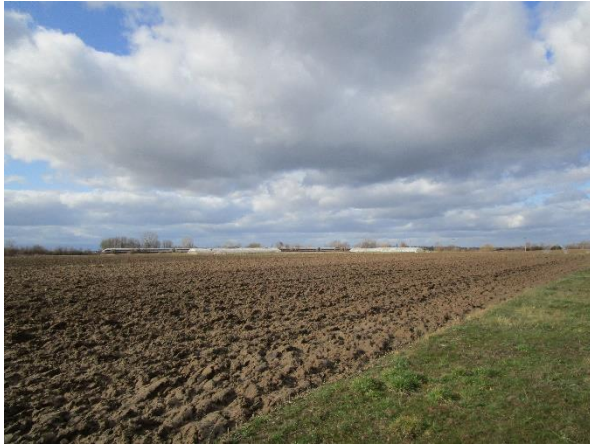
Blick von Osten auf das Plangebiet.