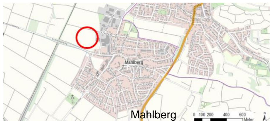
Abb. 1: Lage des Plangebietes (Kreis).

Das Bebauungsplangebiet schließt sich am nordwestlichen Gewerbegebiet am Ortsrand von Mahlberg an. Es wird im Norden durch den „Kreuzweg“ begrenzt, im Süden schließen sich landwirtschaftliche Flächen an. Etwa 140 m südlich der Bebauungsplangrenze verläuft der „Schmiedeweg“.