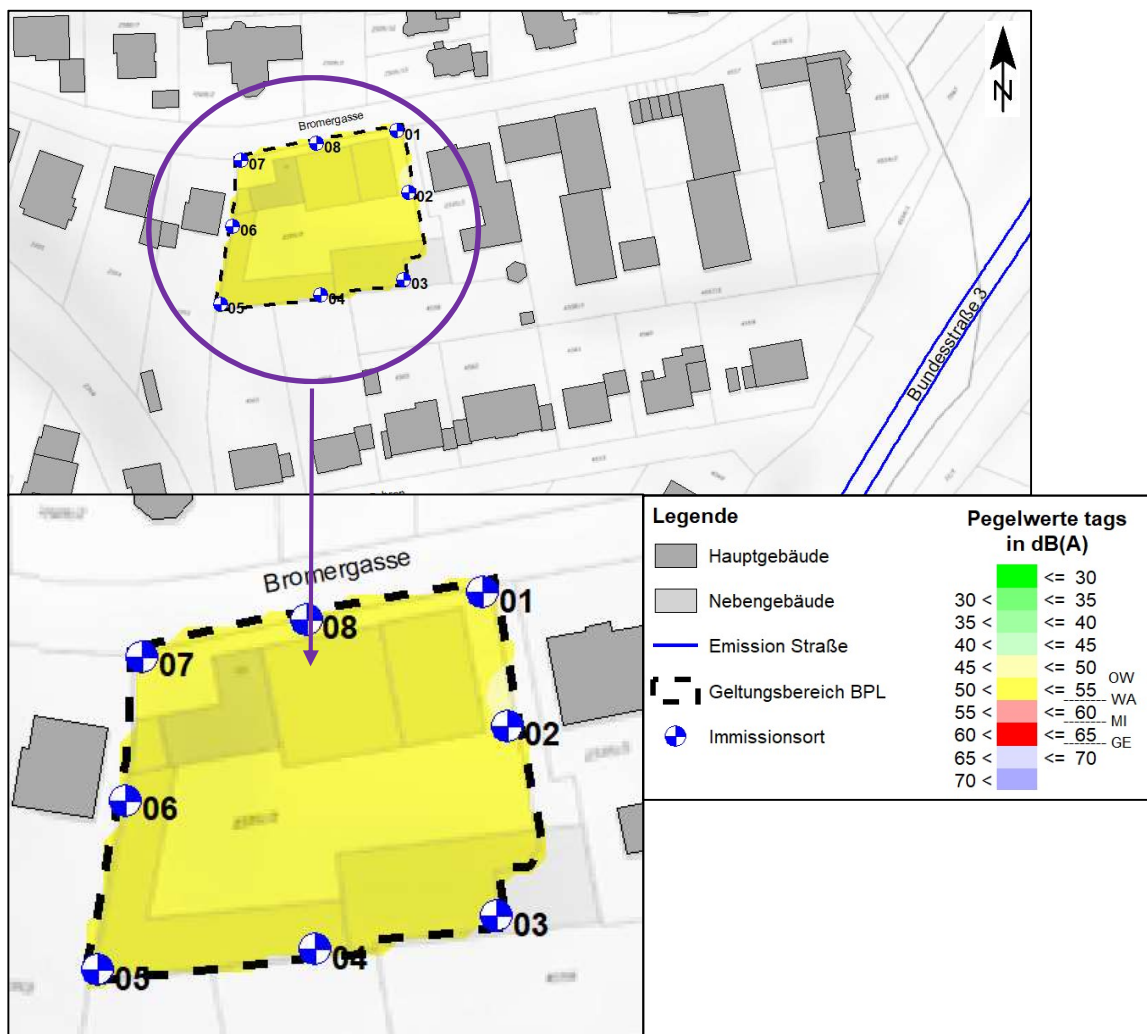
Abbildung 3 – Pegelverteilung Straßenverkehr tags

Die Pegelverteilung durch den Straßenverkehr auf der B 3 ist in den nachfolgenden Lärmkarten (Rechenhöhe 8 m über Gelände – ca. 2.OG) dargestellt. Die Skala der Lärmkarten wurde so gewählt, dass ab den hellroten Farbtönen die Orientierungswerte (OW) der DIN 18005 1 für allgemeine Wohngebiete (WA) (tags 55 dB(A) und nachts 45 dB(A)) überschritten werden.