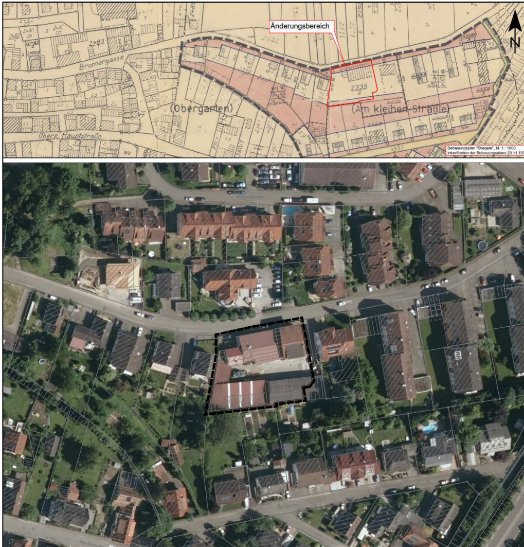
Abbildung 2 – Lage des Bebauungsplan „Stiegele, 7. Änderung“ 1